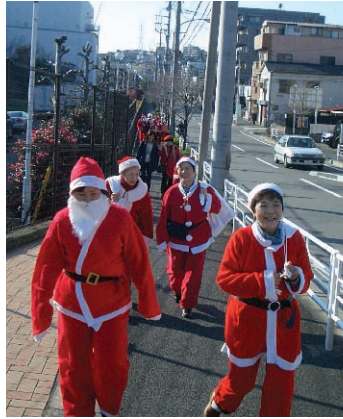
年ごとに鶴見名物になっていく サンタさんです

クリスマスの時期に、区内作業所などを訪問し プレゼントを配ります。女性も歓迎。今年のク リスマス、一緒にサンタになりませんか?