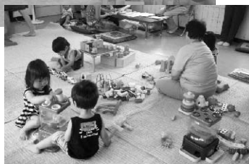
ぼんぼり広場(上末吉地区)

【子育てサロン】居住する地域を拠点に、子育ての当事者など地域の人たちどうして子育てを楽しみ、仲間づくりを行うなど、子育てに関する支え合いの活動です。