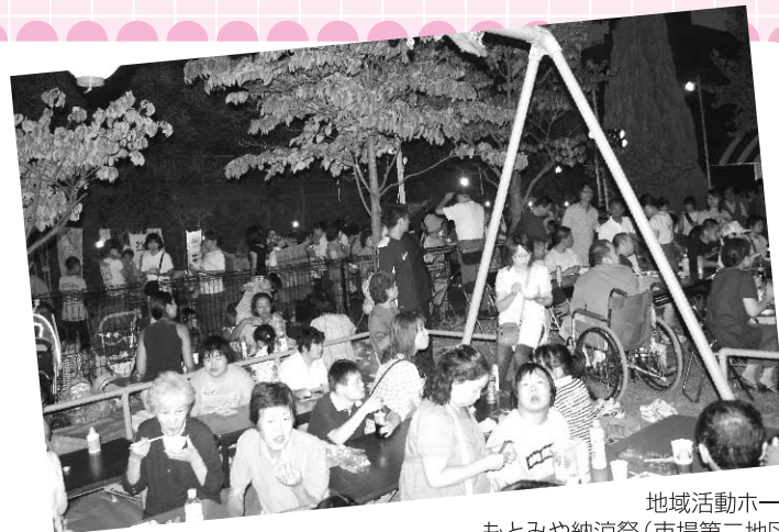
地域活動ホーム もとみや納涼祭(市場第二地区)

【夏祭り】各地区では、地区社協、連合町内会などが共催して夏祭りを開催しています。地区によっては福祉施設等とも協働して開催すると同時に施設開放も行われています。夏祭りが地域住民と交流する機会をつくり、それぞれの立場を考える機会にもなっています。夏祭りの運営には多くの地域のボランティアも協力し、地域みんなで楽しめる夏祭りが運営されています。