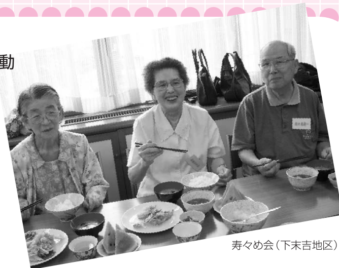
寿々め会(下末吉地区)

会食メニューのこだわりは、旬の野菜・果物を使用し、季節感をだすこと。ヘルスメイトと協働し栄養バランスのとれた食事を提供することを心がけています。