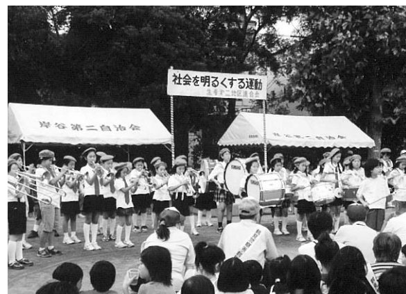
社会を明るくする運動(生麦第二地区社協)

【社会を明るくする運動】はすべての国民が、犯罪や非行の防止と罪を犯した人たちの更生について理解を深め、それぞれの立場において力を合わせ、犯罪のない地域社会を築こうとする全国的な運動で、今年で59回目を迎えました。鶴見区各地区の保護司を中心に連合町内会、地区社協が協働して開催しています。